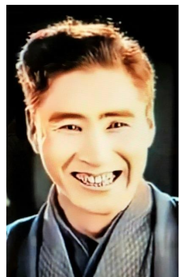
The Dragon Painter (1919) Uchida 役

『セッシュウ！ 世界を魅了した日本人スター・早川雪洲』(中川織江・2012) 168頁