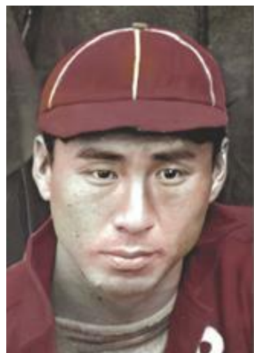
Japanese Base Ball Association (1911)

☆ 藤田東洋は 明治時代に 最初期の日本人「プロ」野球選手 として「グリーン ジャパニーズ」や「JBBA」でアメリカ中西部を巡業した日系一世を代表する堅守巧打の野球選手です